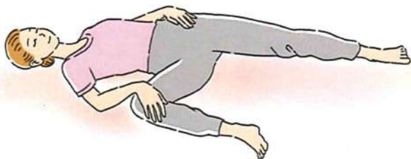
ストレッチは無理のない範囲で行いましょう

することもとても大切。股関節が硬いとケガなどのリスクが高まります。簡単なストレッチとしては、仰向けに寝て、片足の膝を胸へ引き寄せ、膝で円を描くように回します。ほかに、仰向けに寝て片足の膝を90度曲げます。膝の内側付近に手を添え、そのままゆっくり側面の床に倒します。そのとき、足を伸ばした側の腰が浮きすぎると十分に伸ばせないため、足を伸ばした側の手で鼠径部付近を押さえましょう。