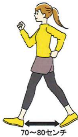
歩幅は広めの70〜80センチが良いそうです

手を椅子などに添え、足は肩幅くらいに広げてまっすぐ立ちます。つま先立ちになり、重心をかけるながらかかとを床につきまます。これを1セットにつき10回、1日3セットがおすすめです。ほかに、仰向けに寝て膝を立てます。片足の膝を伸ばしてゆっくり持ち上げ、5秒ほどキープして元に戻します。これを片足5〜10回繰り返しましょう。