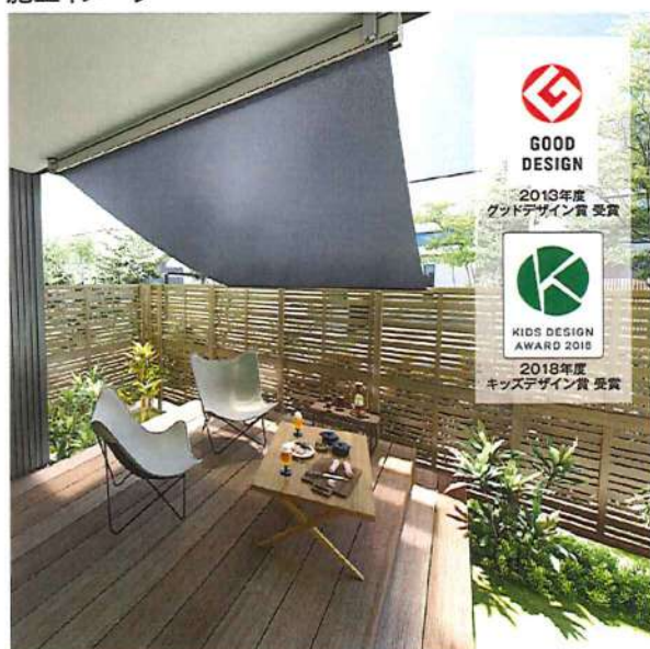
インディゴデニム