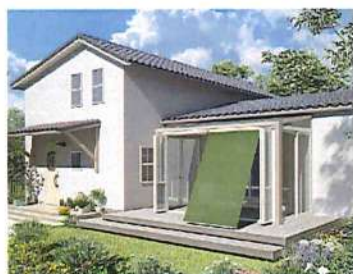
フォレストグリーン