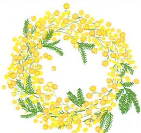
ミモザはリースにしても素敵！インターネットでも手に入るのでチェックしてみてください

生花もおすすめる！自然ならではの繊細で鮮やかな見た目と香りに気が上がります。ミモザは、黄色い小さな花がかわいく、葉っぱの表情とも相まって、とっても華やか。ざっくり