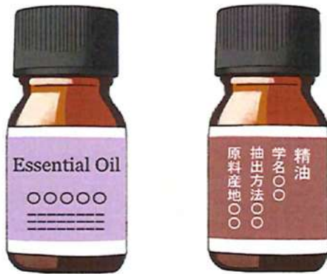
茶色などの遮光瓶に入り、表示に「精油」や「エッセンシャルオイル」とあるので、確認してみましょう

あると言われていきます。ほかに、ティーツリーも抗酸化作用があるのでおすすめです。