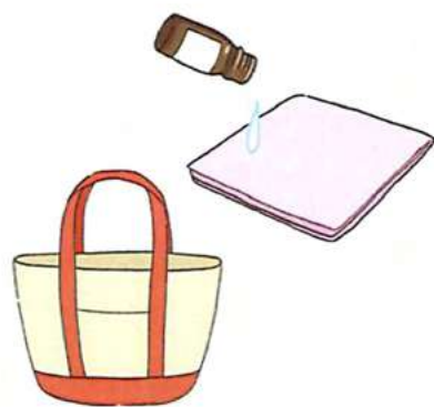
ハンカチに1滴オイルを落とし、嗅ぐのも効果的。外出先にも携帯できずね！

きなどにも良いそうです。甘く、濃厚な香りのイランイランにも気持ち落ち着かせてくれる効果が期待できます。ほかに、スイートマジヨラムやネオリにもリラククス効果があるとされています。 使い方は、香りを拡散させてくれるアロマディフューザーを使ったり、アロマストーンに落とすのもおすすめです。アロマスティックは雑貨店やドラッグストアなどで見られ、手軽に楽しむアイテムとして人気です。